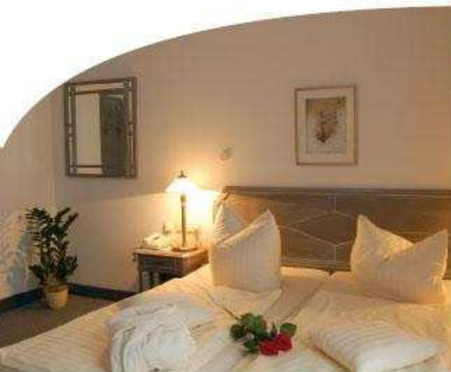
ERLEBEN SIE UNSER HOTEL MIT ALL SEINEN ANNEHMLICHKEITEN