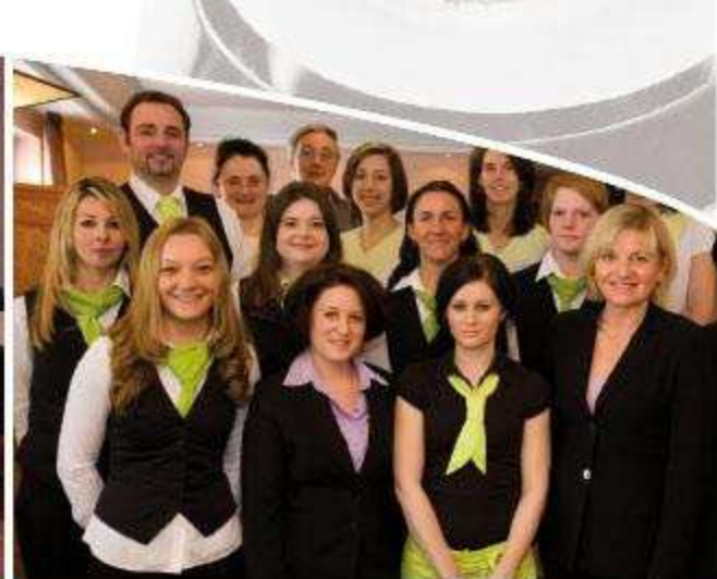
RUNDUM SERVICE FÜR IHREN AUFENTHALT