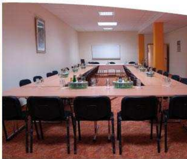
IDEALE BEDINGUNGEN FÜR IHREN SEMINAR ERFOLG